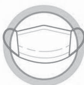
ПОЛЬЗУЙТЕСЬ МЕДИЦИНСКОЙ МАСКОЙ